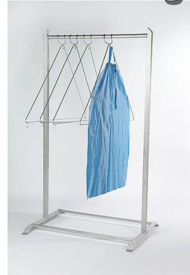
Schürzenbügel Schürzengarderobe zum Aufhängen und Spreizen von Schürzen