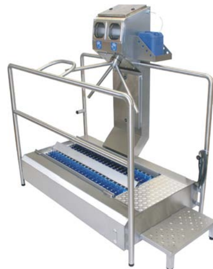
DLISO - SL + EK 400

Durchlaufsohlenreiniger mit überlastungssicherer Zweihanddesinfektion sowie Handreinigung Bürstenlängen: 700 mm oder 1100 mm