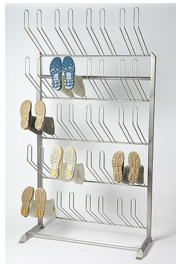
Stiefelhalter Standmodell oder wandhängend ein- oder beidseitig nutzbar für 3 bis 40 Paar Stiefel oder Schuhe