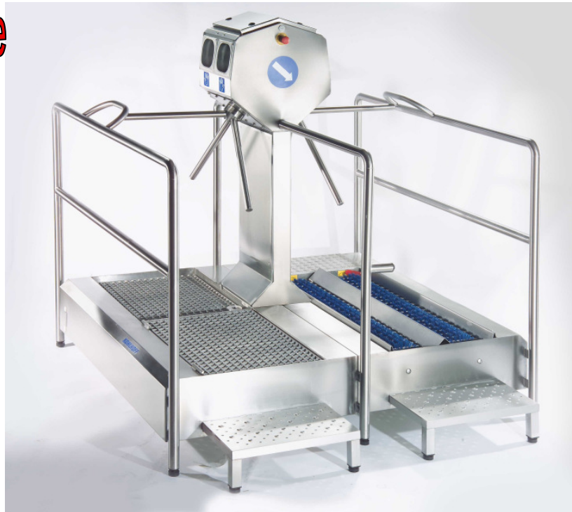
Cleancontrol - zur Erreichung der optimalen Betriebshygiene

Zwangsführung - getrennte Wege zwischen Produktion und Sozialtrakt - kontrollierte Kontrolle der Hände und Sohlen - Zeit - und Datenerfassungssysteme integrierbar