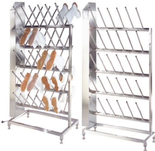
Stiefeltrockner Standmodell oder wandhängend, beheizbar über Zeitschaltuhr ein- oder beidseitig benutzbar für 10 bis 40 Paar Stiefel oder Schuhe