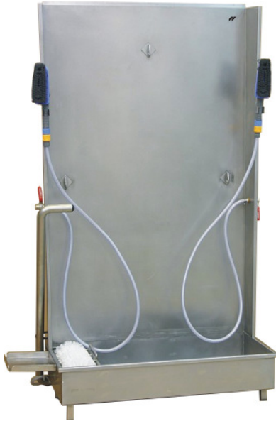
Schürzen-, Stiefel-, Sohlenreinigung mit integriertem Sensorkontakt für Sohlenreinigung BxTxH: 1290 x 680 x 1970 mm Verschiedene Modelle