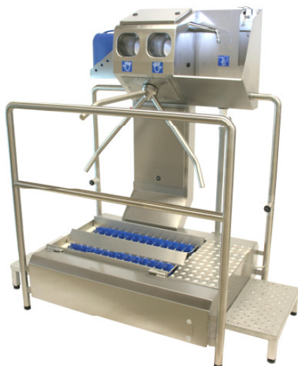
DLISO - SL + EK 400 - HWB

Zwangsführung - getrennte Wege zwischen Produktion und Sozialtrakt - kontrollierte Kontrolle der Hände und Sohlen - Zeit - und Datenerfassungssysteme integrierbar