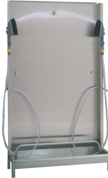
Schürzen- und Stiefelreinigung BxTxH: 1100 x 420 x 1800 mm Verschiedene Modelle